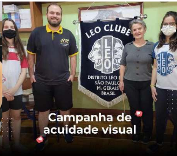
Campanha de acuidade visual