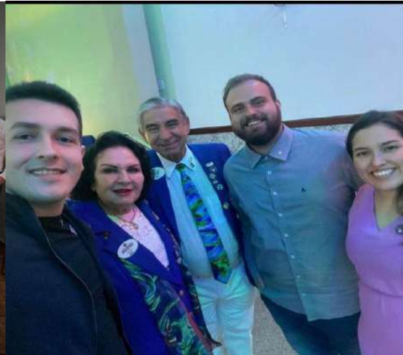
1º Reunião da Governadoria