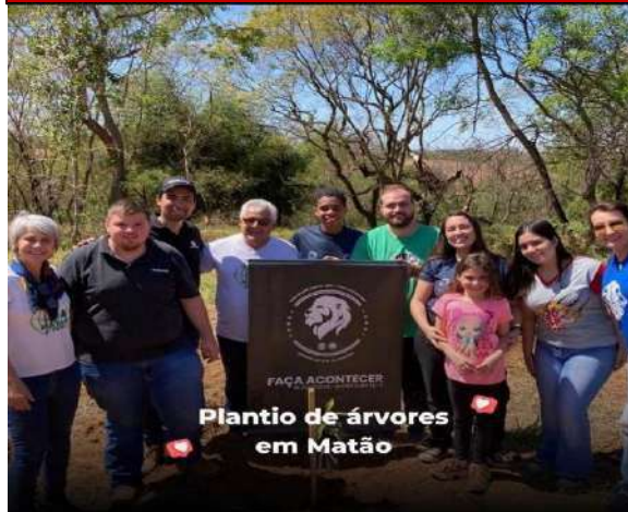
Plantio de árvores em Matão