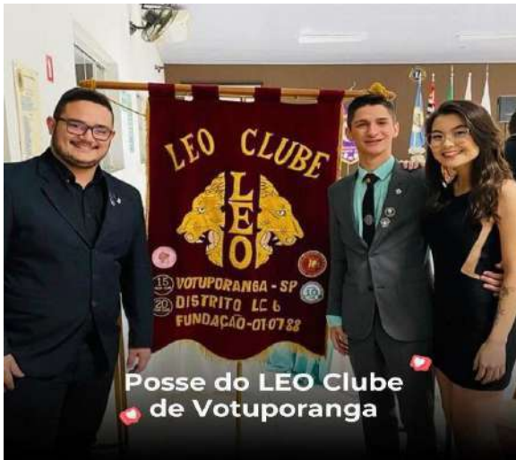
Posse do LEO Clube de Votuporanga