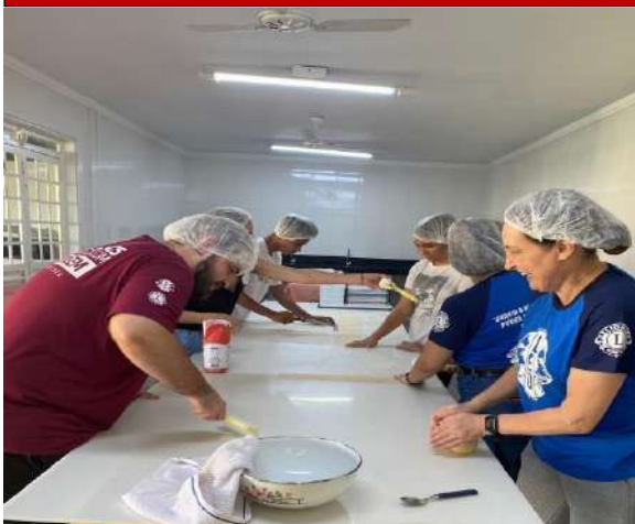
Campanha do Macarrão