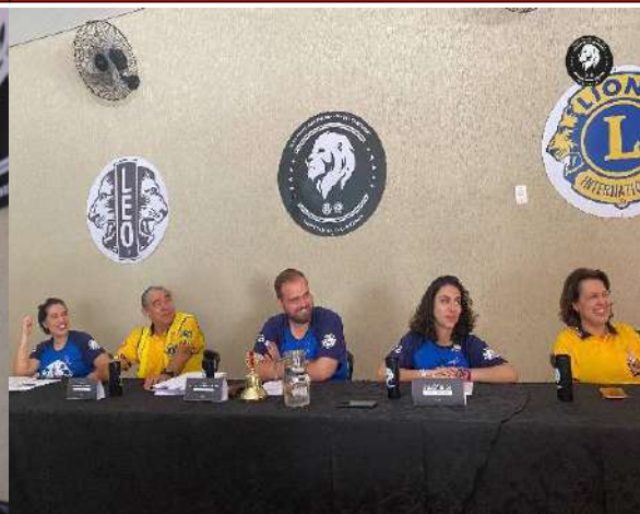
Jantar Maçonaria Monte Azul Paulista