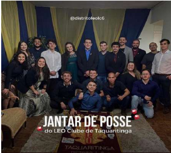
Posse LEO Clube Taquaritinga