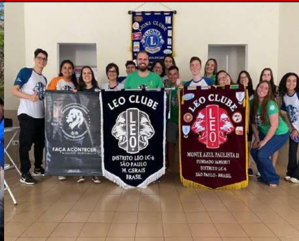
Palestra Setembro Amarelo