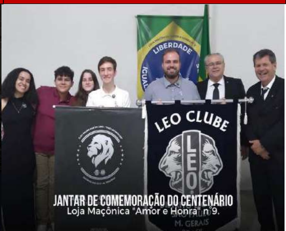
JANTAR DE COMEMORAÇÃO DO CENTENÁRIO Loja Maçonica "Amor e Honra", n.º 9. M. GERAIS BRASIL