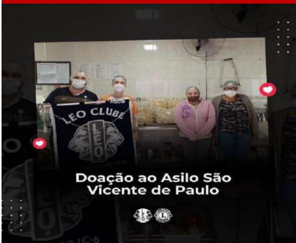
Doação ao Asilo São Vicente de Paulo