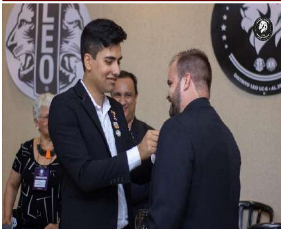
Doação Asilo - Monte Azul Paulista